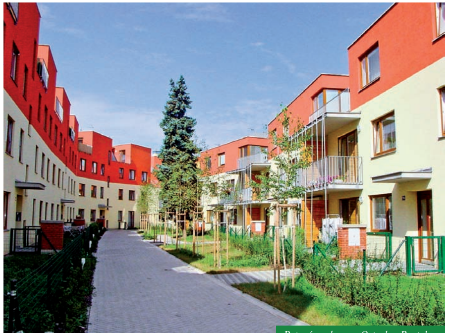
Bytový soubor na Ostrohu, Roztoky

Jinak si s ostatními stavebními společnostmi samozřejmě někdy zdravě konkurujeme a jin-