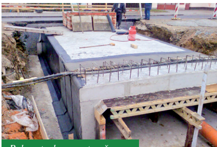
Rekonstrukce mostu přes Hrádecký potok - realizace