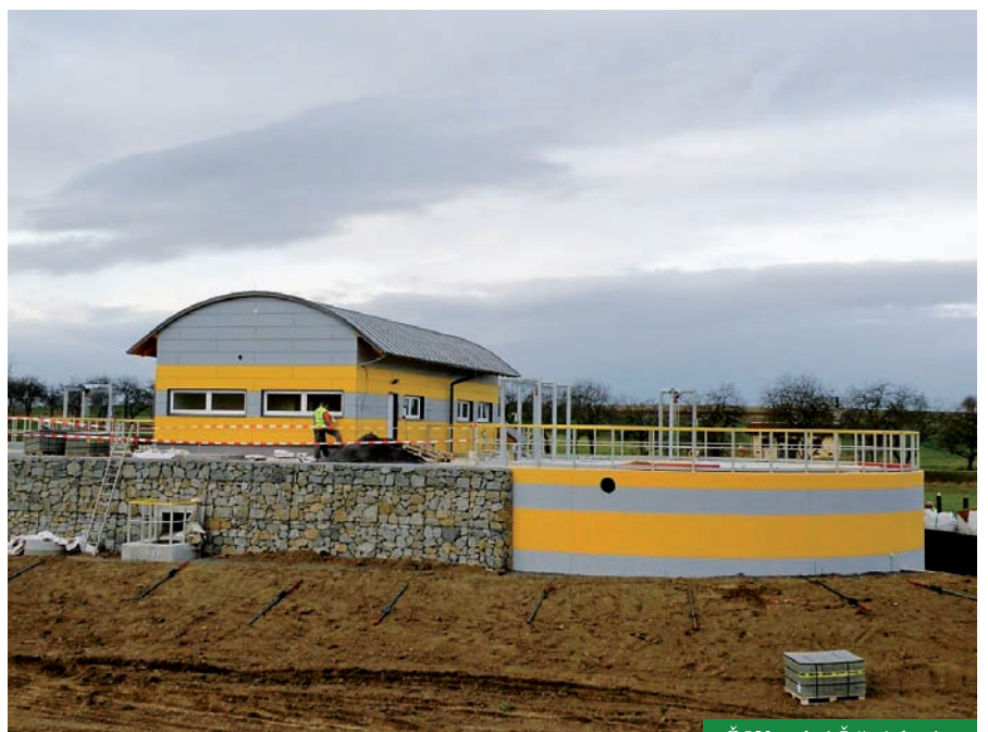
ČOV v obci Štěpánkovice

V současnosti je pak naší nejkrásnější stavbou probíhající rozšíření ZOO Plzeň s řadou