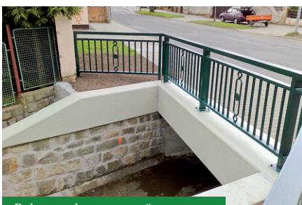
Rekonstrukce mostu přes Hrádecký potok - dokončené dílo